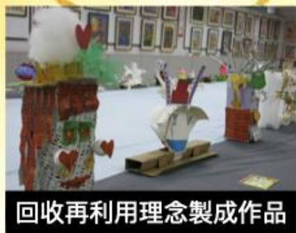
回收再利用理念製成作品