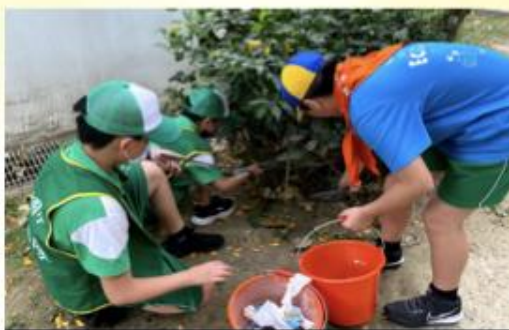
校內環境主動清掃