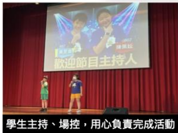
學生主持、場控，用心負責完成活動