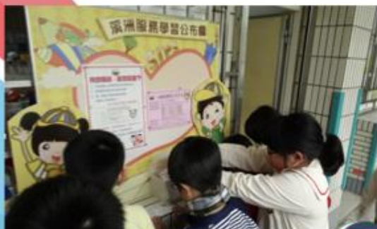
校園活動徵招小志工