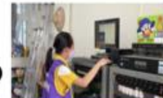
播音組幫我們放送音樂