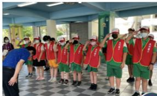
校內長期服務團隊授證