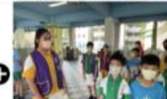
頒獎組的小朋友協助頒獎、喊口號