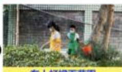
有人打掃百草園 (讓欣賞植物的空間不雜亂)