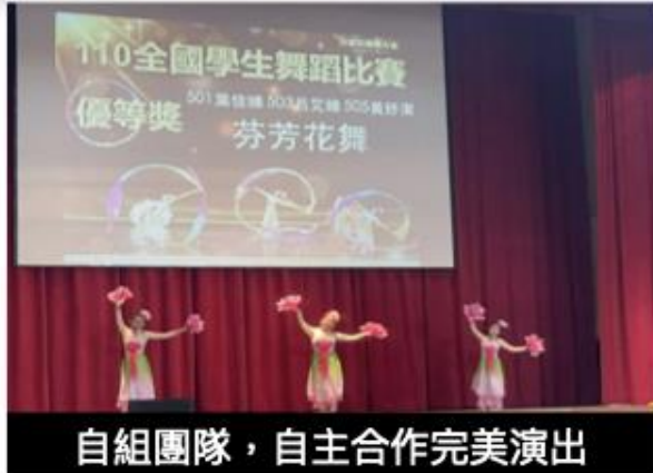
自組團隊，自主合作完美演出