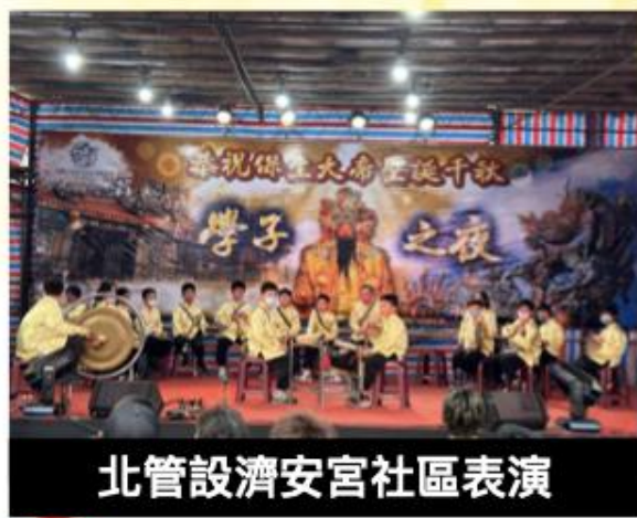
北管設濟安宮社區表演