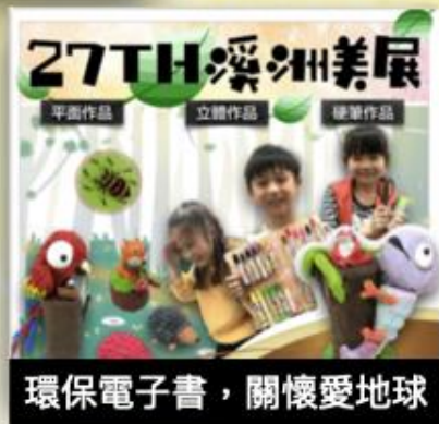
環保電子書，關懷愛地球