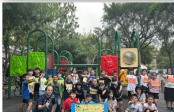
學校社區行動劇展演宣導

本校營養午餐食在地魚，協同表演、綜合課程主題教學，學生展現自主、關懷與公德行動劇宣導