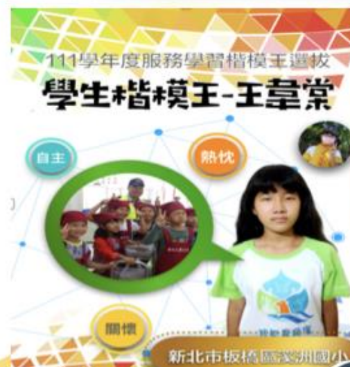
鼓勵學生參與服務學習認證