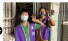
場控組幫我們確認播音