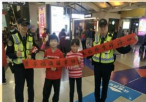
春節校外快閃贈春聯