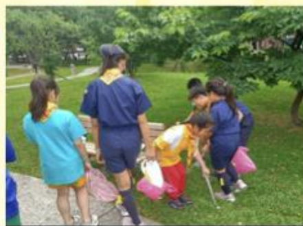
社區公園清掃活動