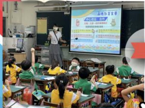
品德教育上課情形