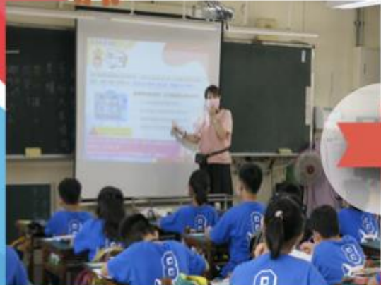
法治教育上課情形