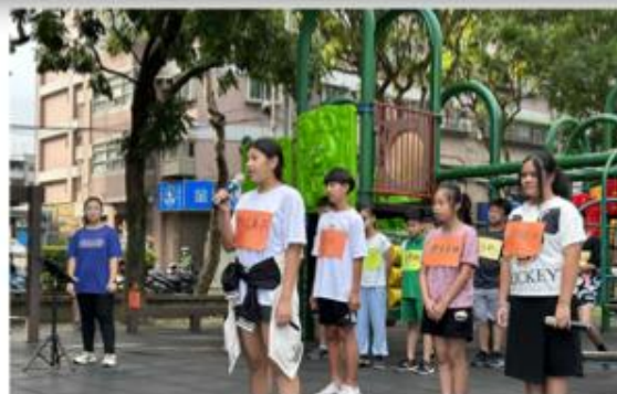
買對魚，吃對魚，才能年年有魚