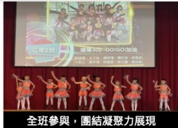
全班參與，團結凝聚力展現