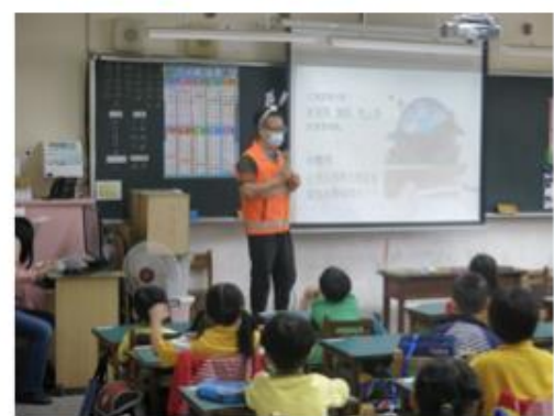
故事媽媽志工 工程爸爸說故事