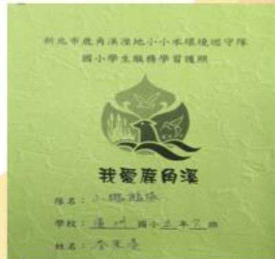
鹿角溪服務記錄卡