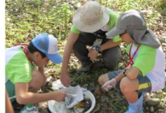
管理維護鹿角溪生態環境