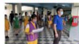
司儀幫我們主持流程