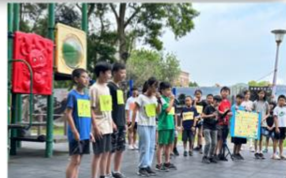
親師生合作，為生態盡一份力