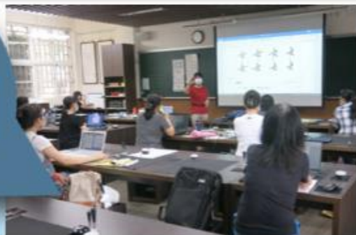
培訓志工教師各校服務