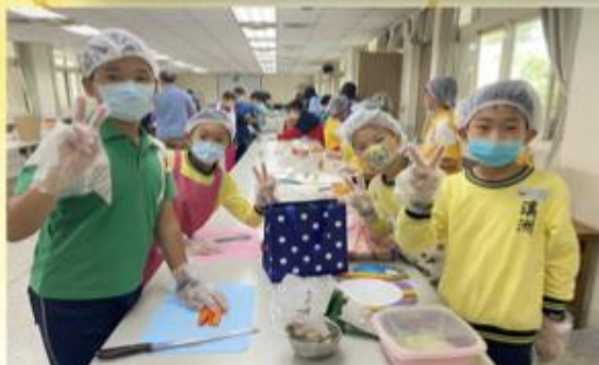
回收再利用理念製成作品