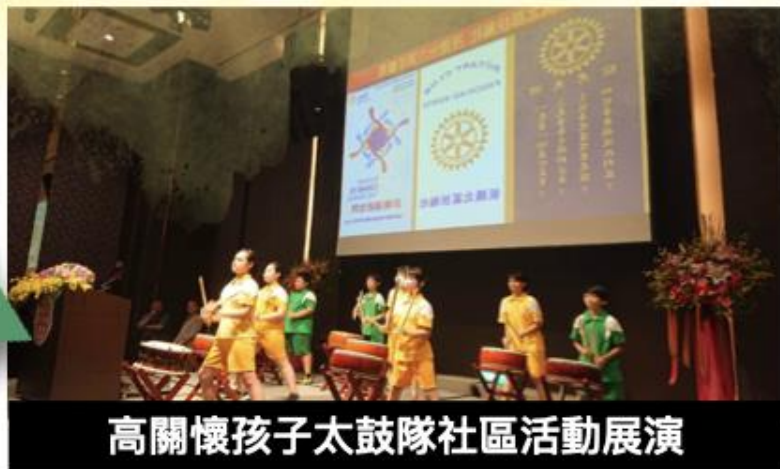
高關懷孩子太鼓隊社區活動展演