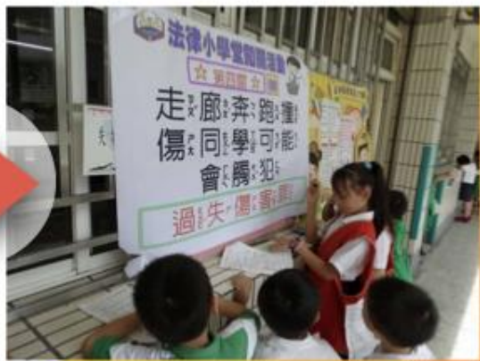
期末法律大會考/闖關