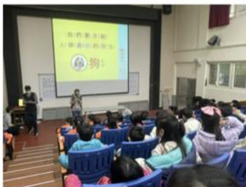
愛護動物生命教育巡迴課程 寶貝狗協會愛護動物