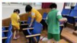
有同學打掃119視聽教室 (讓我們有乾淨的椅子和地板使用)