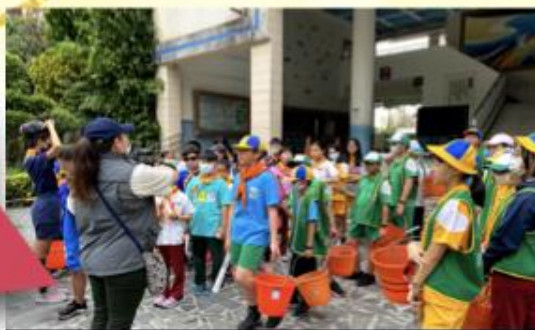
與衛生隊連團服務活動