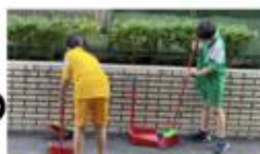
有同學打掃環校道路 (道路減少落葉和砂石，維護大家安全)