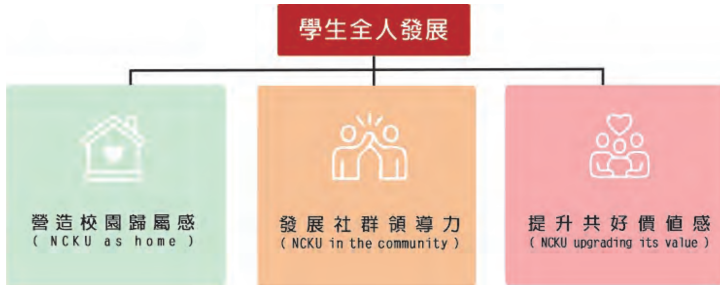
學務工作推動發展架構圖