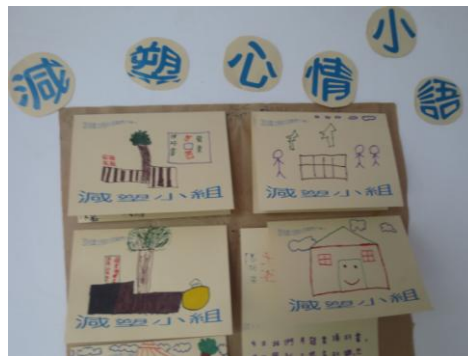
學生減塑活動心得回饋

減塑行動劇社區快閃成果影片：連結網址 https://www.youtube.com/watch?v=BbRBnXv0iBo