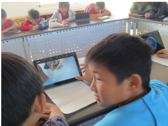
學生利用平板搜集海洋垃圾報導