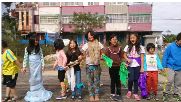
減塑行動劇社區快閃演出