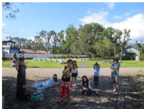
減塑行動劇校園快閃演出