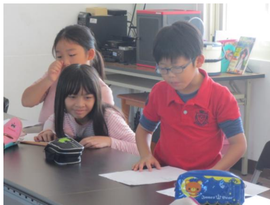
小組發表海洋垃圾造成的環境問題