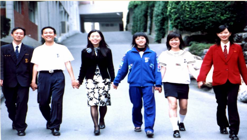
扶弱拔尖一起向前走