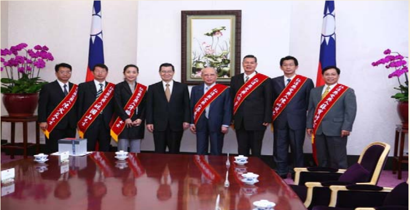
校長榮獲98年全國傑出教師弘道獎，蒙 蕭副總統萬長先生接見嘉勉