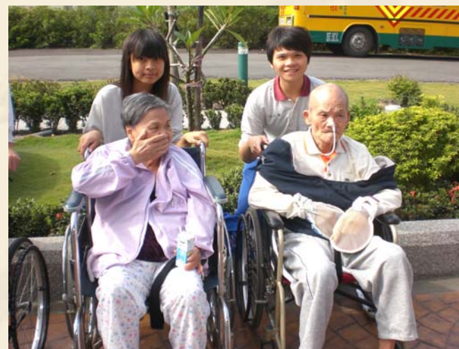
99.11.10名倫養護中心 學生陪伴爺爺奶奶們到戶外曬太陽