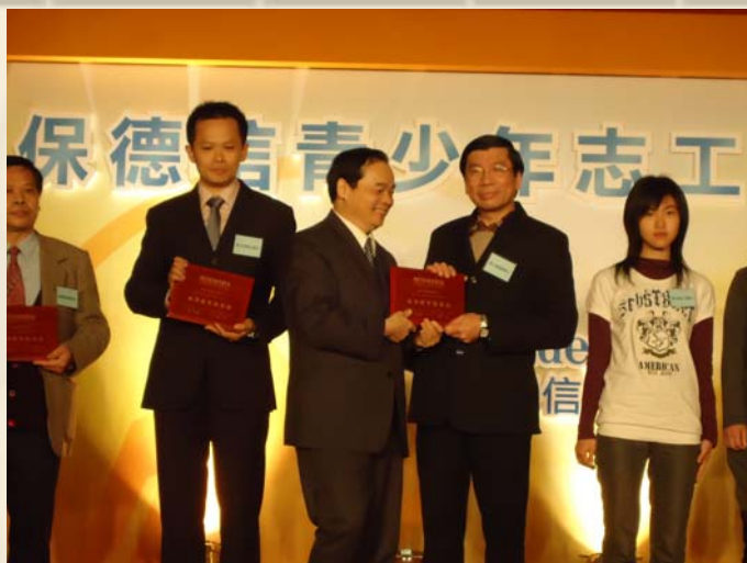
本校連續八年榮獲保德信服務教育楷模學校獎