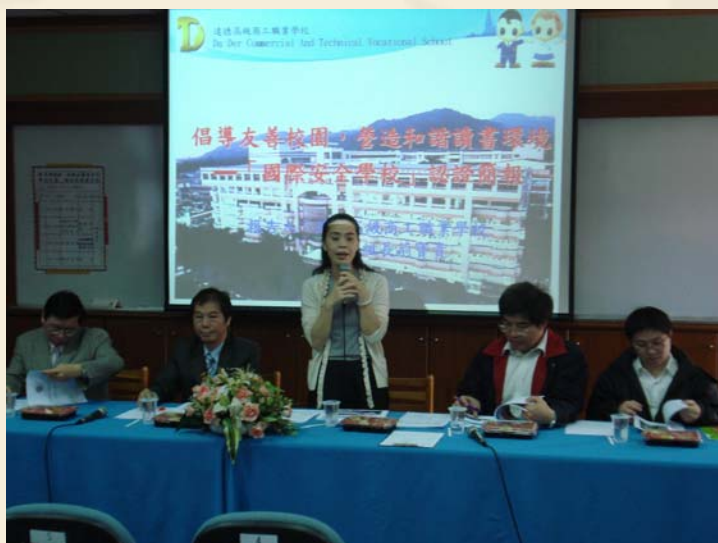
督察訪查本校榮獲反霸凌安全示範學校