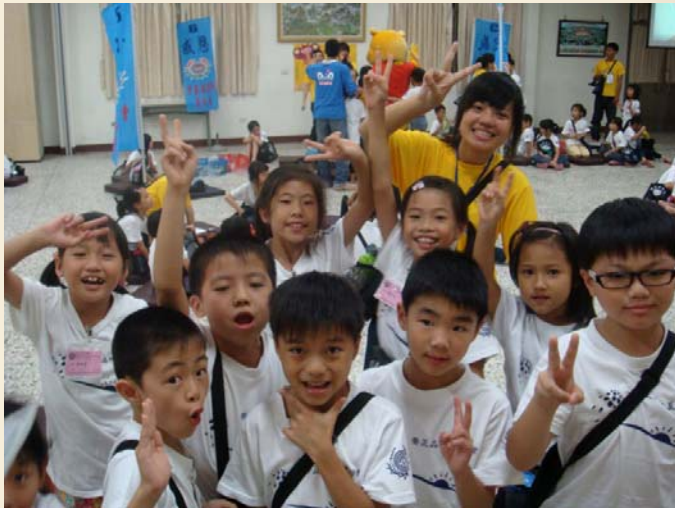
帶領小朋友進行團康活動